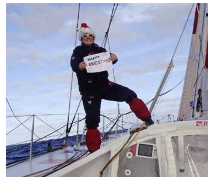
Pendant le Vendée Globe organisé en 2008, la navigatrice Samantha Davies célébrait Noël toute seule à bord de son voilier.