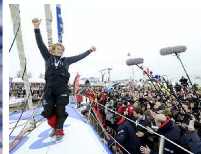
François Gabart a été le vainqueur de la course en 2013. Comme lui, tous les marins sont heureux d'arriver. Mais reprendre une vie normale après tout ce temps passé seul en mer est toujours long et difficile.

Une fois pris le départ du Vendée Globe, les marins ne mettront plus pied à terre jusqu'à l'arrivée . Ils peuvent jeter l'ancre dans une crique le temps de faire une réparation, mais ils n'ont pas le droit de débarquer. Sinon, ils sont disqualifiés. Il leur faut donc rester à bord pendant les 40 000 kilomètres du parcours !